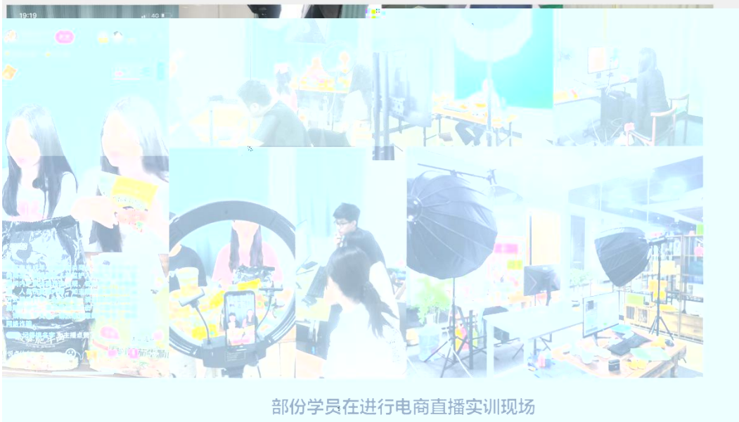
部份学员在进行电商直播实训现场